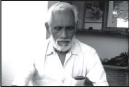
శ్రీ బ్రహ్మాంగారి మఠంలో సత్సంగం తరువాత ధ్యానం