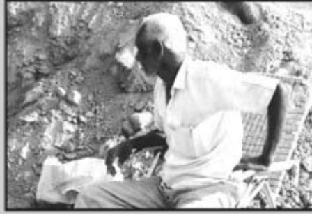
శ్రీ సాయి మాస్టర్ విద్యాలయ నిర్మాణ పర్యవేక్షణ