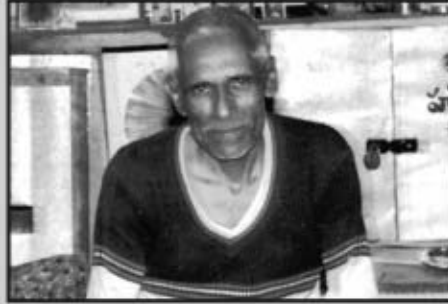
శ్రీ సాయి మాస్టర్ నిలయంలో సార్