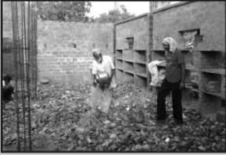
శ్రీ సాయి మాస్టర్ నిలయం-2 నిర్మాణం

సద్గురు శ్రీ సుబ్బరామయ్య మాస్టర్ లీలామృతం